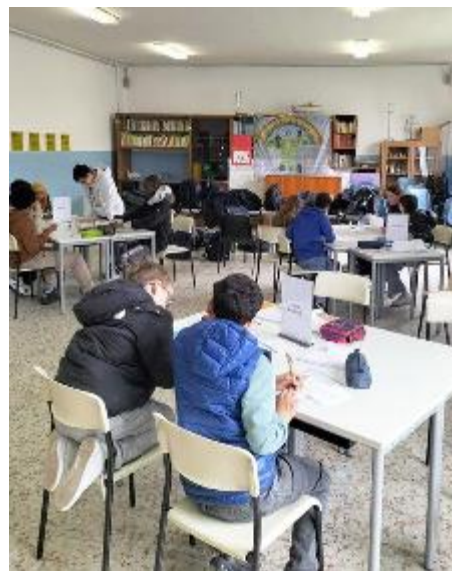
Gli alunni impegnati nella didattica a 'stazioni'