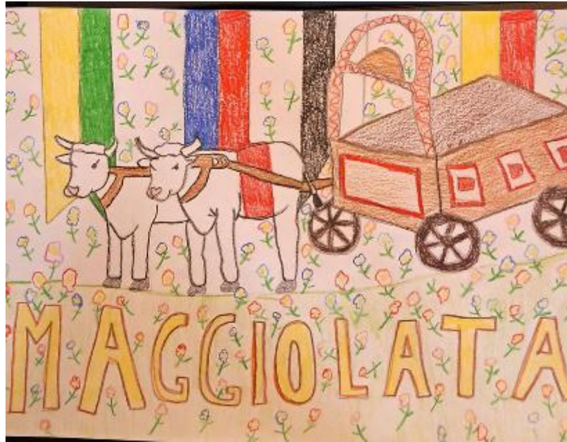
La Maggiolata vista e disegnata dagli alunni della 5 A

Durante la sfilata, i carri attraversano le vie del borgo, accompagnati dalla musica di bande e gruppi folkloristici in costume. Il capitano del popolo, seguito dal gruppo storico dei musicisti e degli