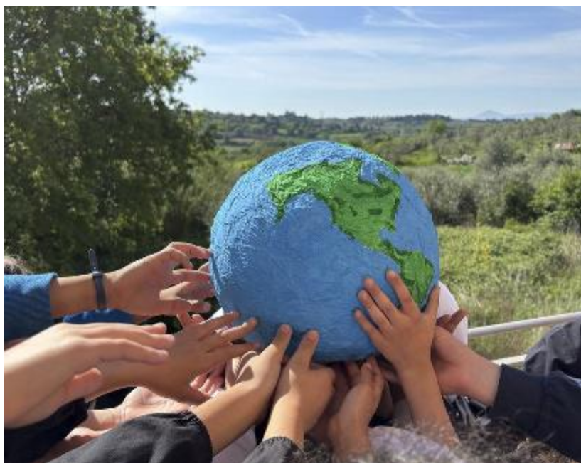
Il mondo in cartapesta realizzato dagli alunni della 3 A

L'iniziativa ebbe un enorme successo, portando milioni di persone a scendere in piazza per chiedere azioni concrete volte a proteggere il pianeta. La Giornata della Terra è un'importante promemoria della necessità di adottare stili di vita più sostenibili e di ridurre l'impatto ambientale delle nostre azioni quotidiane. Essa ci invita a riflettere su temi importanti come: - Cambiamenti climatici, riconoscere il ruolo delle attività umane nel riscaldamento globale e promuovere l'uso di energie rinnovabili. - Biodiversità, proteggere le specie a rischio e promuovere la conservazione degli habitat naturali. - In-