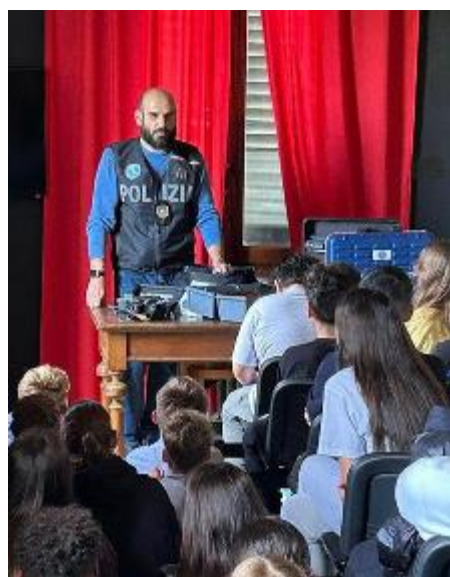
Un momento dell'incontro