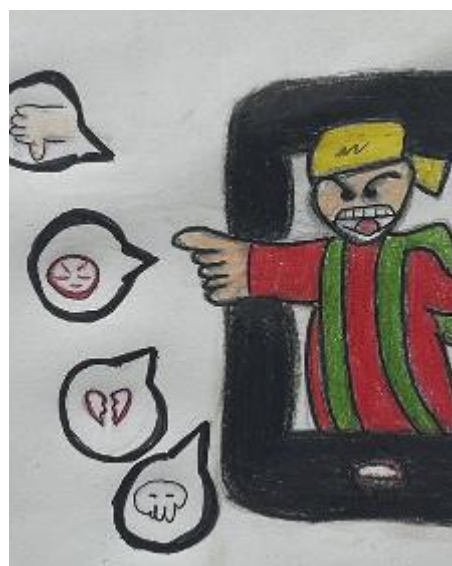
Disegno realizzato dall'alunno Sowa Christian