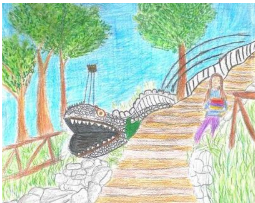
Il disegno del Giardino del Drago

Noi, studenti delle Scuole Pie Fiorentine, abbiamo il privilegio di avere la scuola situata a due passi dal centro storico, in via La Marmora, da cui si intravede la cupola del Brunelleschi. Il cuore di Firenze però non è solo ricco di monumenti e luoghi famosi: nasconde infatti tanti angoli meno conosciuti che ci hanno visto crescere e sono diventati per noi posti del cuore, legati a ricordi quotidiani e momenti condivisi. Il nostro 'itinerario' parte proprio da scuola. Uscendo e incamminandoci verso Piazza della Libertà, siamo sulla strada per arrivare al Giardino dell'Orticoltura. Questo parco ospita al suo interno una biblioteca, un parco giochi e un bar che durante l'estate resta aperto dalla mattina alla sera, diventando un punto di ritrovo per giovani e famiglie. Durante la primavera è qui che si svolge la Mostra Mercato dei fiori: un evento in cui fiorai locali allestiscono stand colorati per presentare piante, fiori e particolari oggetti d'arredo per il proprio giardino. Un'altra oasi verde vicina alla nostra scuola è l'Orto Botanico: uno spazio antichissimo esclusivamente dedicato alla cura delle piante e dei fiori. Fondato da Cosimo de' Medici nel 1545, conserva al suo interno oltre 5000 piante ed è un luogo perfetto per prendersi una pausa. È bellissimo da visitare durante la fioritura, quando i colori e i profumi