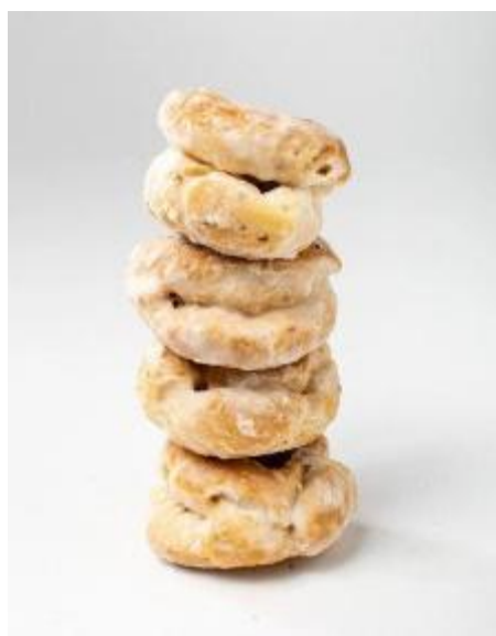
I famosi zuccherini della Val di Bisenzio

Vernio, si preparano gli Zuccherini: sono dei biscotti a forma di ciambellina che fanno di anice e sono ricoperti da una glassa di zucchero bianca come la neve, nati per celebrare i momenti di festa. A Migliana, invece, è successo un fatto curioso. Per sbaglio, mentre preparavano i classici cantucci, al posto delle mandorle sono finiti nell'impasto dei pezzi di cioccolato. Il risultato? È nato il Biscotto di Migliana: più morbido e super goloso.