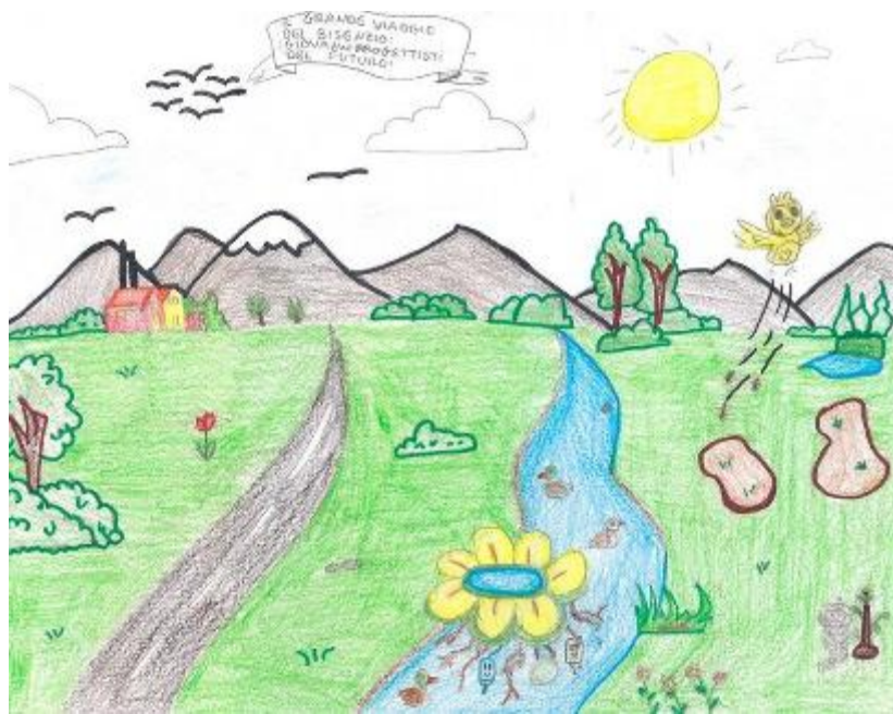
La vignetta a corredo della pagina è stata realizzata dalla VD

Non è solo un corso d'acqua, ma un vero e proprio 'nonno' saggio che ha visto nascere la città e crescere le industrie. Il fiume Bisenzio, che nasce tra le vette di Cantagallo e conclude la sua corsa tuffandosi nell'Arno, nei pressi di Signa, è il cuore pulsante della piana. Ma quanto lo conosciamo davvero? Spesso lo guardiamo distrattamente passandoci sopra in auto, eppure sotto i suoi ponti scorre la linfa vitale del nostro territorio. Per secoli, il Bisenzio è stato l'operaio più instancabile della zona. Già nel Medioevo, la sua forza non andava sprecata: grazie alla costruzione delle gualchiere e delle gore - canali artificiali - ha permesso ai mulini di macinare il grano e le castagne e alle prime fabbriche tessili di muovere i macchinari. Senza il 'Gigante Blu', Prato e i comuni della piana non sarebbero diventati i distretti famosi in tutto il mondo per i loro tessuti. Oggi la sua importanza non è più solo economica, ma vitale per l'ambiente. «Il fiume è un corridoio ecologico fondamentale», spiegano gli esperti. È un rifugio sicuro, un vero 'hotel a 5 stelle', per l'airone cinerino, e anche per molte specie di pesci. Tra i canneti si nascondono simpatiche anatre e la fauna selvatica ritrova qui uno spazio per vivere lontano dal caos urbano. Le sue sponde sono polmoni verdi perfetti per passeggiate a piedi o in bicicletta. Tuttavia, il rapporto con il nostro fiume non è fatto solo di ricordi positivi. Nel novembre del 2023, abbiamo visto il volto