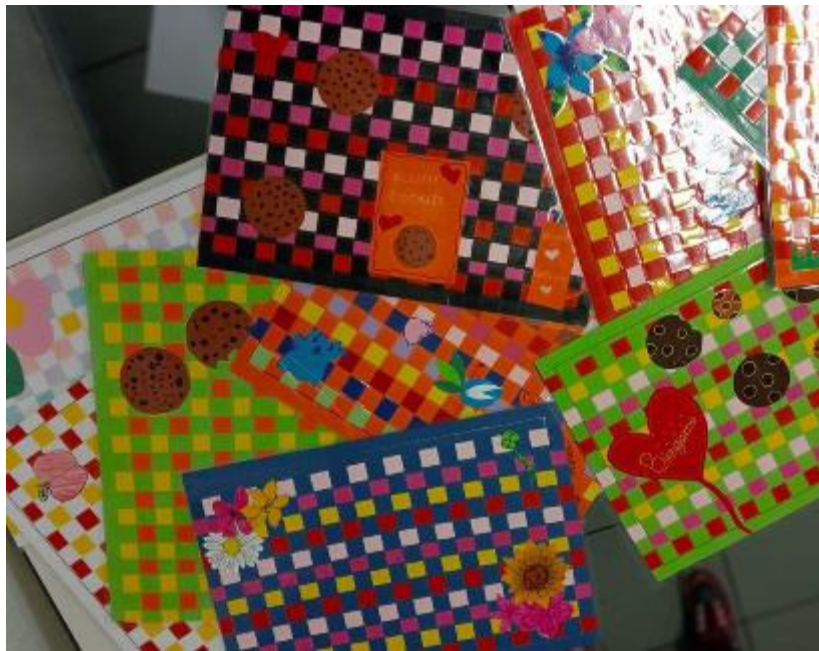
Il materiale riciclato dagli alunni durante il laboratorio di tecnologia