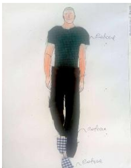
Il bozzetto realizzato dagli alunni della 1D

più piccola e usala come contenitore o organizzatore 7. Riusa l'acqua con cui sciacqui il riso prima di bollirlo o la verdura prima di cucinarla (puoi innaffiarci le piante) 8. Taglia a metà una bottiglia di plastica e fanne un contenitore per chiavi, spiccioli o bottoni 9. Se hai patate germogliate, non buttarle ma piantale di nuovo in un vaso e aspetta che nascano delle patate tue 10. Se un vestito non ti sta più, provalo su un tuo fratello o sorella più piccoli.