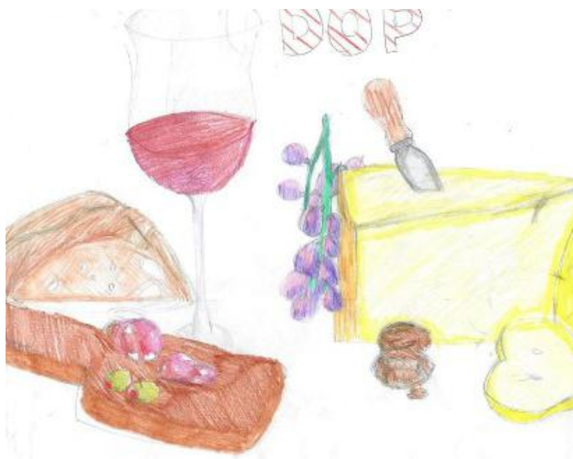
I prodotti tipici. Disegno realizzato dalla 1 a B della Secondaria di Terricciola

L'Italia è conosciuta in tutto il mondo per le sue eccellenze culinarie e la ricerca della qualità di prodotti utilizzati in cucina che hanno una ricca tradizione Dop, Igp e Docg. Molti sono i pilastri del gusto italiano, ne indichiamo alcuni: parmigiano reggiano, grana padano, la mozzarella di bufala campana, pecorino toscano e romano, prosciutto San Daniele e prosciutto di Parma, coppa piacentina, capocollo di Calabria, pomodoro San Marzano, pomodorino del piennolo del Vesuvio e la patata di Bologna e poi l'aceto balsamico di Modena, il tartufo di Alba, il pistacchio di Bronte. Tra i legumi e cereali ci sono il riso di Baraggia Biellese e Vercellese, l'olio extravergine toscano, del Lazio della Puglia, dell'Umbria e della Sardegna, senza dimenticare lo «afferano dell'Aquila e il pane di Altamura e una lunga lista importante di vini. Un viaggio infinito tra sapori e profumi che contraddistinguono la nostra penisola. Il marchio Dop (Denominazione di origine protetta) è un riconoscimento europeo attribuito a prodotti agricoli e ad alimenti di eccellenza. Esso garantisce che le fasi di produzione, la trasformazione ed elaborazione avvengano interamente in un'area geografica delimitata, rispettando un disciplinare rigoroso e legando la qualità al territorio. A differenza del marchio Igp (Indicazione geografica protetta), il Dop è più restrittivo. La sigla Docg significa Denominazione di origine controllata e garantita è il marchio italiano di