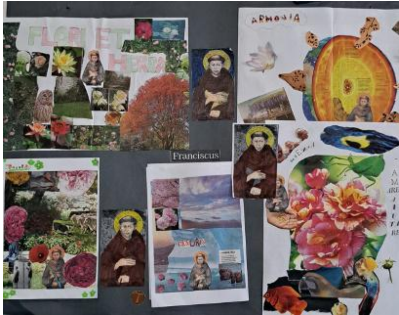
Sulle orme di San Francesco, nell'ambito del progetto "Custodi del Creato"

Come hai fatto ad essere così libero da sposare, come dice Dante, una donna che per secoli nessuno ha voluto più? Noi invece ci leghiamo alle cose ancor più che alle persone.