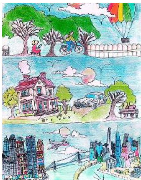
La tecnologia ha trasformato il mondo

-Organizzare incontri con personale esperto che aiuti a riflettere sui comportamenti e a gestire le proprie emozioni.