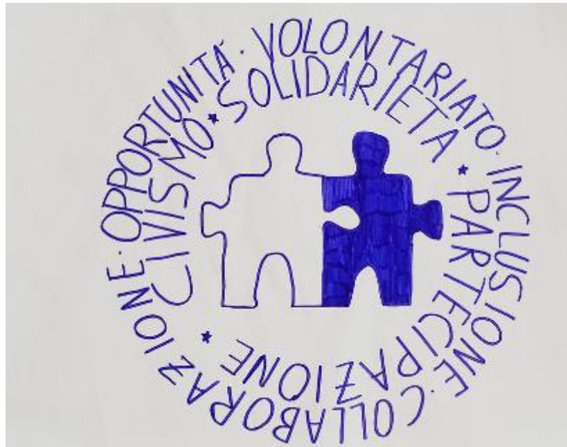
Il logo dell'associazione realizzato dalla classe

La sede si trova a Barga, vicino all'Oratorio del Sacro Cuore ed accoglie - dal lunedì al giovedì, spesso per due ore - tutti coloro che vogliono partecipare alle molte attività ricreative proposte. In un ambiente caratterizzato da amicizia, compagnia e inclusione, vengono svolti laboratori di tanti tipi diversi che puntano a stimolare fantasia,