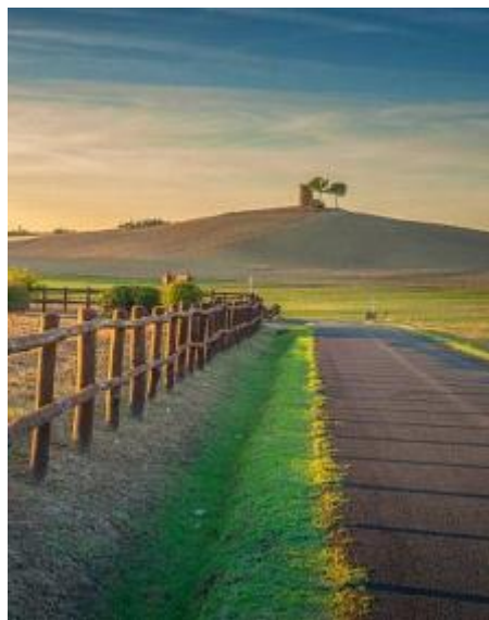
Alla scoperta del territorio