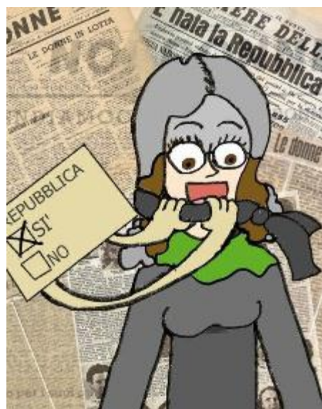
Disegno realizzato da Lodelli Alessandro