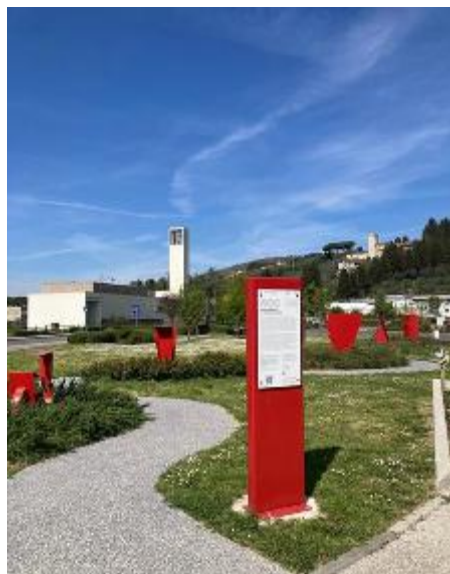
L'installazione davanti alla biblioteca CiviCa