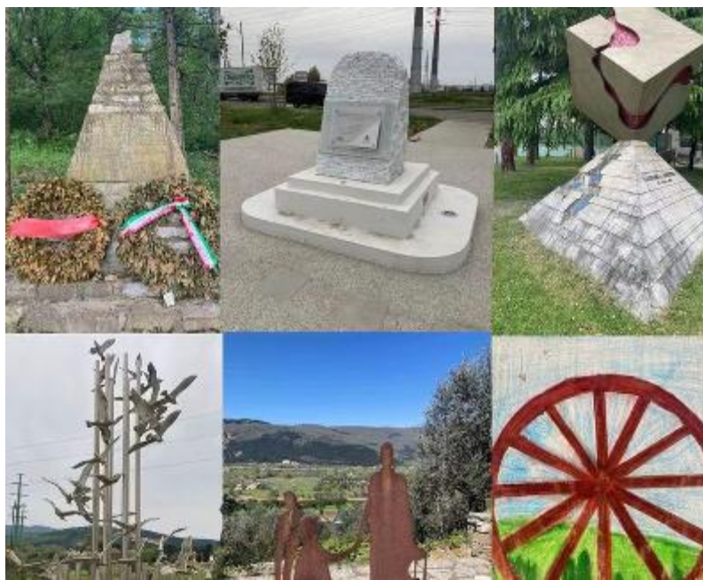
I monumenti del territorio

Poco distante e ancor più recente, sorge il monumento inaugurato il 9 dicembre 2025 in ricordo delle cinque vittime dell'esplosione del deposito Eni, avvenuta l'anno prima: un evento ben impresso nella nostra memoria dato che quel giorno eravamo a scuola e d'improvviso abbiamo sentito una forte esplosione seguita da un'alta colonna di fumo nero che ci ha davvero spaventati. Molti sono anche i monumenti che celebrano la Resistenza, a cominciare dal Me-