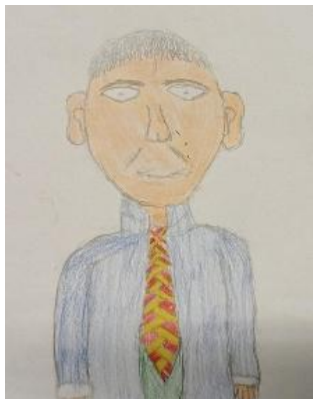
Vignetta realizzata dai ragazzi della classe IV D

resta di questo passato industriale! Ma se ben ci penso anche qui vicino alla vostra scuola ci dovrebbero essere delle gore, oramai più in funzione». «Maestra, che bello il racconto del tessitore, ma te come le sai queste cose?». «Io sono figlia di un filatore, ho vissuto in filatura fin da quando son nata! Quando ero stata particolarmente brava mi mandavano giù alle vasche dell'allupino era il mio premio mi piaceva tanto quel posto! Ma questa è un'altra storia».