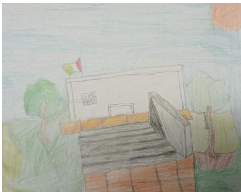
Vignetta realizzata dai ragazzi della classe IV D

Curzio Malaparte era uno scrittore importante, che viaggiava, ma il suo cuore tornava sempre a Prato! Se andiamo alla Biblioteca Lazzerini possiamo trovare frasi dedicate allo scrittore e al suo amore per questa città, ad esempio «io son di Prato, m'accontento di esser di Prato, e se non fossi nato pratese,