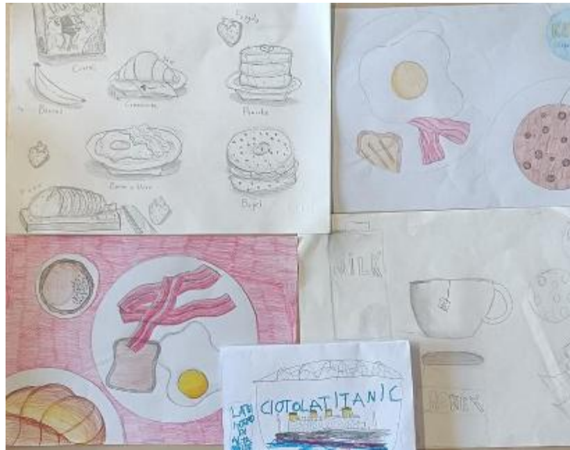
Come raffigurano la buona e sana colazione in casa gli alunni in concorso

In Francia si mangia il pain au chocolat mentre, in Grecia si preferisce lo yogurt con miele, cannella e semi di Chia. Americani o Inglese preferiscono una colazione con uova e Bacon o pancakes. La colazione araba prevede un tè tipico chiamato "ezei" accompagnato da biscotti. Molto particolare anche la colazione filippina o giapponese, salata, con riso e sardine. Anche l'Albania ha la sua particolarità, il Bureke, un tortino di pa-