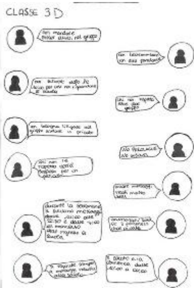
Le regole da rispettare

8 - Si risponde sempre alle domande relative alla scuola e ai compiti. Adesso le parole offensive, le bestemmie e gli sticker che prendono in giro i vari componenti del gruppo non sono più utilizzati. Purtroppo con la presenza di regole, la chat sembra essere meno interessante e può accadere che, alla richiesta di compiti, non risponda nessuno. Ma ci troviamo tutti d'accordo sul fatto che queste regole sono state importanti per la nostra crescita, non solo quella digitale, ma anche quella personale.