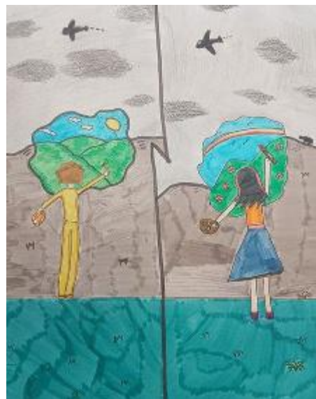
Disegno in fuga dalle guerre

Se le condizioni di guerra miglioreranno dovremmo rientrare il 27 aprile, ma non ne sono sicuro...».