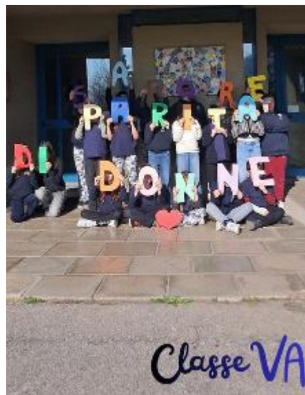
Scritta sulla parità 'indossata' dagli studenti