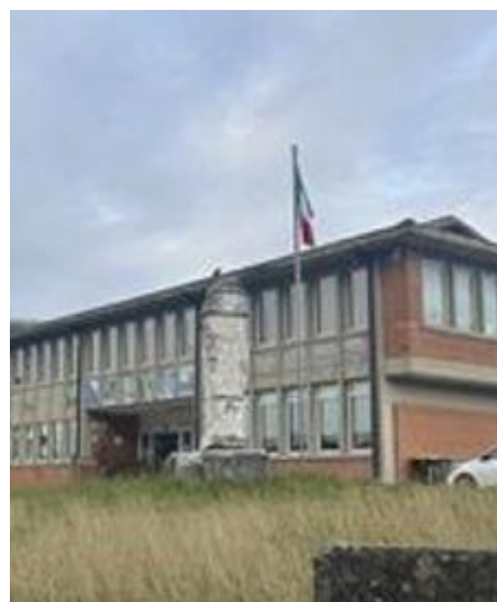
L'istituto comprensivo Moratti Bonomi

Gli alunni si sono poi confrontati con le prelibatezze della cucina locale, descrivendo le nostre eccellenze. Si dice siano stati lo street food più conosciuto dell'antichità e che risalgano addirittura al periodo romano. La storia narra che i panigacci erano diffusissimi anche nel Medioevo: i pellegrini che percorrevano la via Francigena si fermavano a Massa Carrara e venivano accolti dai residenti, che erano soliti offrire loro proprio i panigacci.