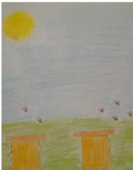
Le arnie disegnate dai ragazzi

Podere Lovara è situato nel parco delle Cinque Terre ed è stato donato nel 2009 al Fai. La Fondazione sta usando questa tenuta agricola per proteggere la biodiversità, molto importante per l'ambiente ma è in pericolo. Le api hanno un ruolo insostituibile, non solo per la produzione di miele ma soprattutto come pilastro della biodiversità. Questi preziosi animali sono in pericolo, muoiono a causa di pesticidi e prodotti agrochimici, malattie, perdita di habitat, cambiamenti climatici, stress da gestio-