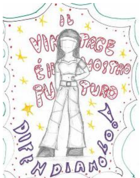
Disegno sul vintage che è il nostro futuro

certo modo contraddistingue, esprime valori e un punto di vista sul mondo. Il vintage richiama un mondo passato, fa rivivere un sogno. Ti caratterizza come una persona interessante, dalla personalità decisa e originale. Comunque, non importa definire esattamente cosa si intende per usato, l'importante è operare scelte virtuose che riducano gli sprechi e il consumo. Non abbiamo alternative al cercare, in ogni modo, di preservare un pianeta ormai malato, bisognoso delle nostre cure.