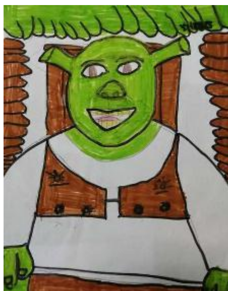
Disegno di Kadri Nejazi