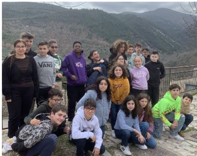
Gli studenti reporter della Lanzi hanno fatto un'inchiesta sui colori e gli stereotipi

«Riteniamo che le conversazioni faccia a faccia siano sempre quelle che colpiscono di più. Un'idea potrebbe essere quella di parlarne