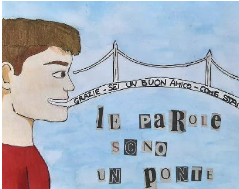
Il disegno realizzato dalla 2 A B della Busoni sulle parole che sono un ponte