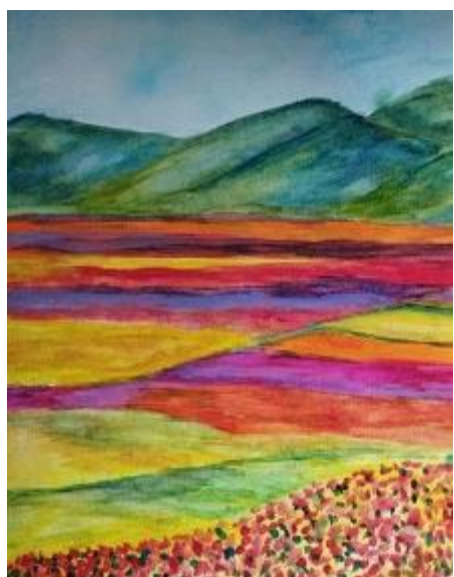
Il prodigio della fioritura, visto dai ragazzi

trimonio culturale unico e le radici di una comunità. Tuttavia, la Piana di Castelluccio è minacciata da varie sfide, tra cui cambiamenti climatici, pressioni antropiche e rischi di urbanizzazione. La crescita sostenibile e la tutela dell'ambiente sono diventate priorità essenziali per garantire che questa perla naturalistica non venga compromessa. Ognuno di noi ha un ruolo importante da svolgere nel garantire che questa meraviglia continui a prosperare per le generazioni future.