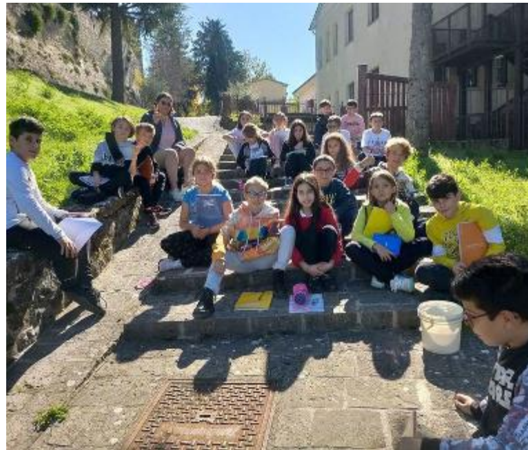
Gli studenti reporter della 'Polidori'

Oggi abbiamo tanti strumenti per arginare il disturbo