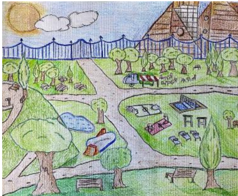
Disegno fatto da Alessandro Recchia e Lorenzo Montagni

Siamo andati al parco a intervistare i suoi frequentatori: le idee non mancano