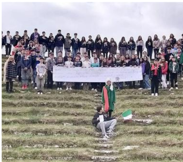
Gli studenti reporter della Mastro Giorgio-Nelli

Volontà e amore verso gli altri «Fatti non parole» come dice Davison