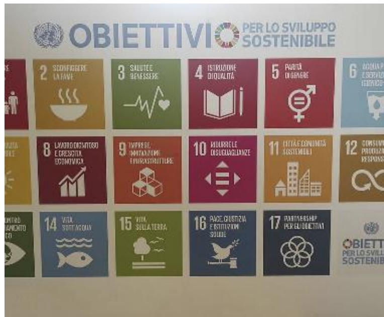
Gli obiettivi per uno sviluppo sostenibile

Da carrello e piatto a ciò che ci circonda Le nostre scelte incidono sul mondo