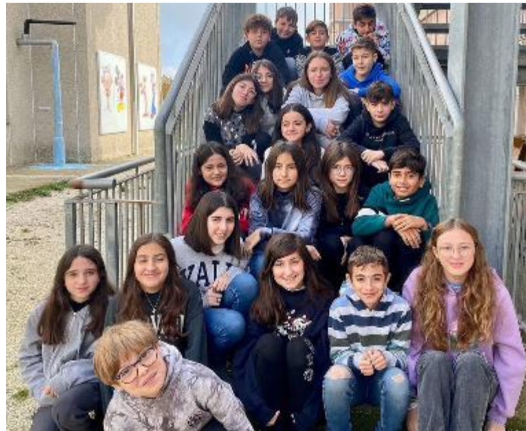
Gli studenti reporter della classe 2B del plesso di San Mariano

«Abbiamo capito che leggere stimola la curiosità e allontana i pensieri»