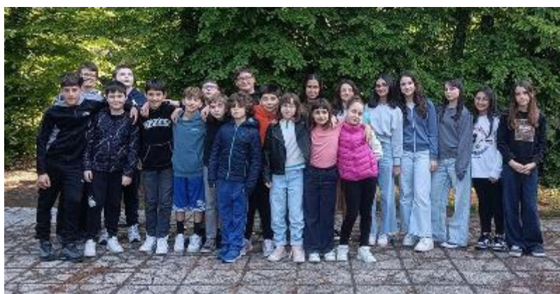
La 1^F dell'IC Leopardi di Castelnuovo Rangone, sotto le vignette realizzate dagli studenti