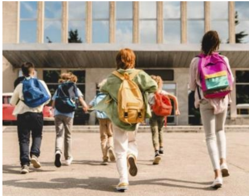
Un'immagine di studenti selezionata dagli alunni del Sacro Cuore

Le domande riguardavano le nostre materie preferite, gli ambiti in cui eccelliamo, le nostre passioni, il nostro metodo di studio, le discipline che ci costano maggior impegno e le prime idee su quale indirizzo ci sarebbe piaciuto fare. Ci veniva anche chiesto cosa ci causava indecisione. Le nostre risposte sono state poi interpretate dai professori per formulare un consiglio orientativo. Se molti di noi sono