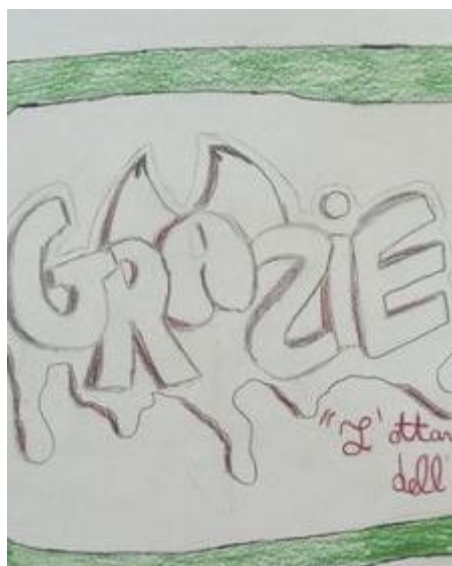
La parola Grazie, «Ottava meraviglia del mondo»