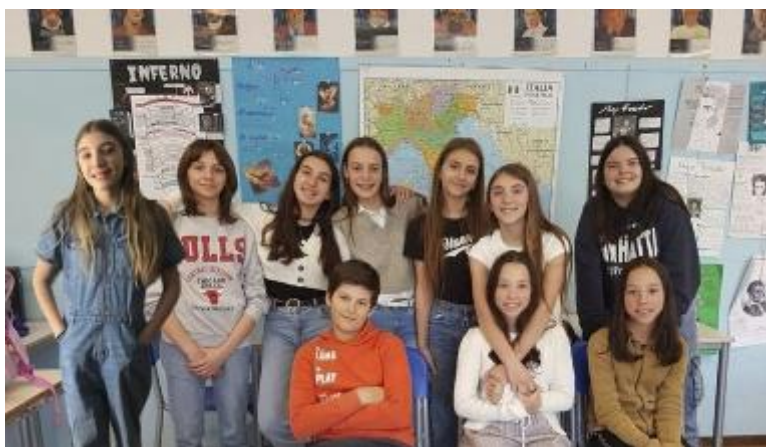
La classe 1^G della scuola secondaria di I grado 'G. Fassi' di Carpi

Milioni di persone al mondo soffrono di malattie croniche e non tutte hanno lo stesso accesso alle cure. Cosa si intende con l'espressione «malattie croniche»? Non è facile definire questo argomento a parole «semplici», ma noi ci proveremo lo stesso. Le malattie croniche presentano sintomi che non si risolvono col tempo e che non portano a un miglioramento. Secondo la definizione medica sono croniche tutte le patologie che presentano un lento e incessante declino delle normali funzioni fisiche. Vi sono molti tipi di malattie croniche, ma tra le più diffuse si trovano il diabete e il cancro. Il diabete è una malattia che presenta alti livelli di glucosio nel sangue ed è causata dalla poca produzione di insulina