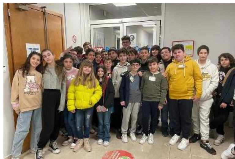
I giovani reporter con i loro insegnanti nella nostra redazione

sta: il primo è avere la capacità di osservare e il secondo è la curiosità, ma bisogna sapere anche che un cronista "non ha orario", si lavora giorno e notte, anche durante le festività, perché la cronaca non aspetta! Al termine di questa esperienza, abbiamo potuto condividere le nostre riflessioni, ecco quanto è emerso: diventare cronista è appassionante, poiché è bello sapere che gli altri leggono ciò che tu hai scritto. Andare a caccia di fatti da raccontare, verificandone le fonti e divulgando le notizie è importante, perché permette ai lettori di rimanere informati. Ricordiamo infatti che la libertà di stampa e di opinione è sancita dalla nostra Costituzione ed è il fondamento di ogni democrazia. Tutti soddisfatti della visita, per le parole semplici e comprensibili, usate dalla nostra guida e per tutto quanto ci è stato illustrato, siamo tornati nella nostra "redazione scolastica", pronti per metterci alla prova. Seguiteci nelle nostre prossime pubblicazioni, nell'ambito della nuova edizione di Cronisti in Classe: faremo sentire la nostra voce, cercando di mantenere il rigore della cronaca e dell'inchiesta giornalistica.