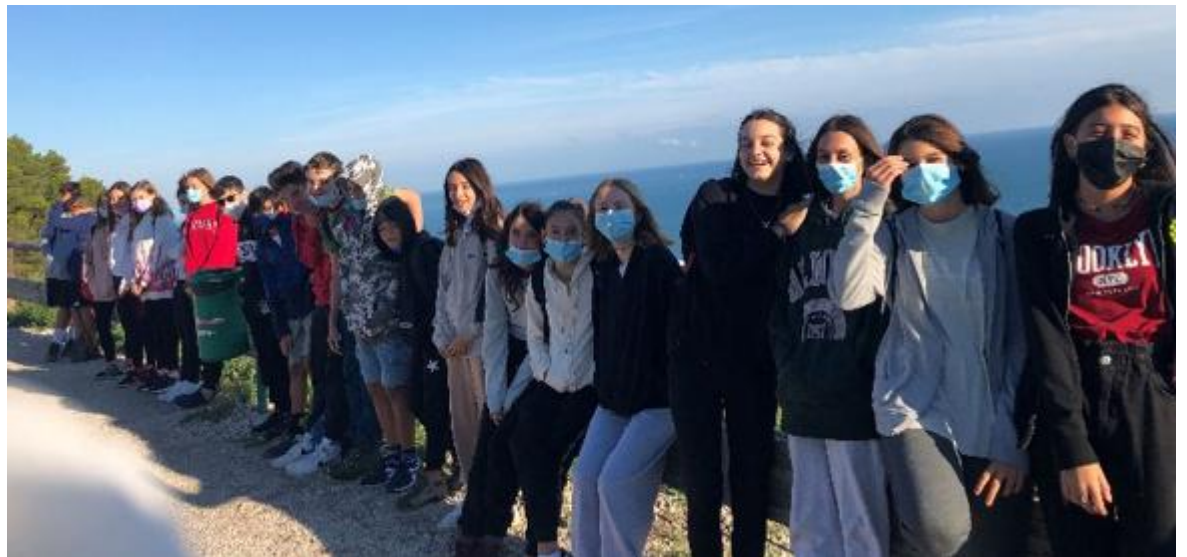
La classe III B della scuola media 'Pirandello'

M. L'infinito è ciò che non ha limiti. Per indicare l'infinito viene utilizzato un simbolo, un otto orizzontale. Mi piace pensare che cono-